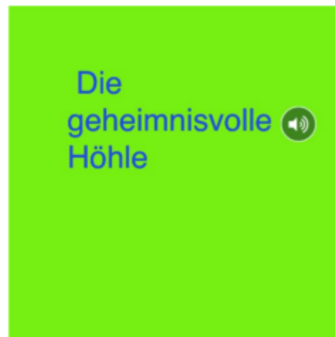
Präsentation von SuS-Ergebnissen